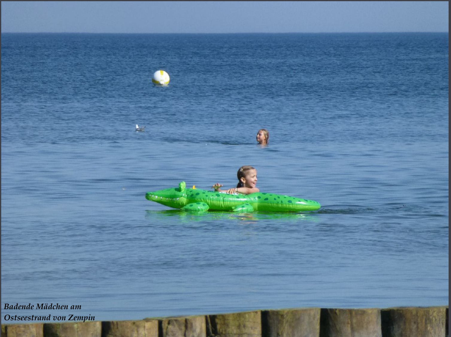
Badende Mädchen am Ostseestrand von Zempin

Nicht da ist man daheim, wo man seinen Wohnsitz hat, sondern wo man verstanden wird.