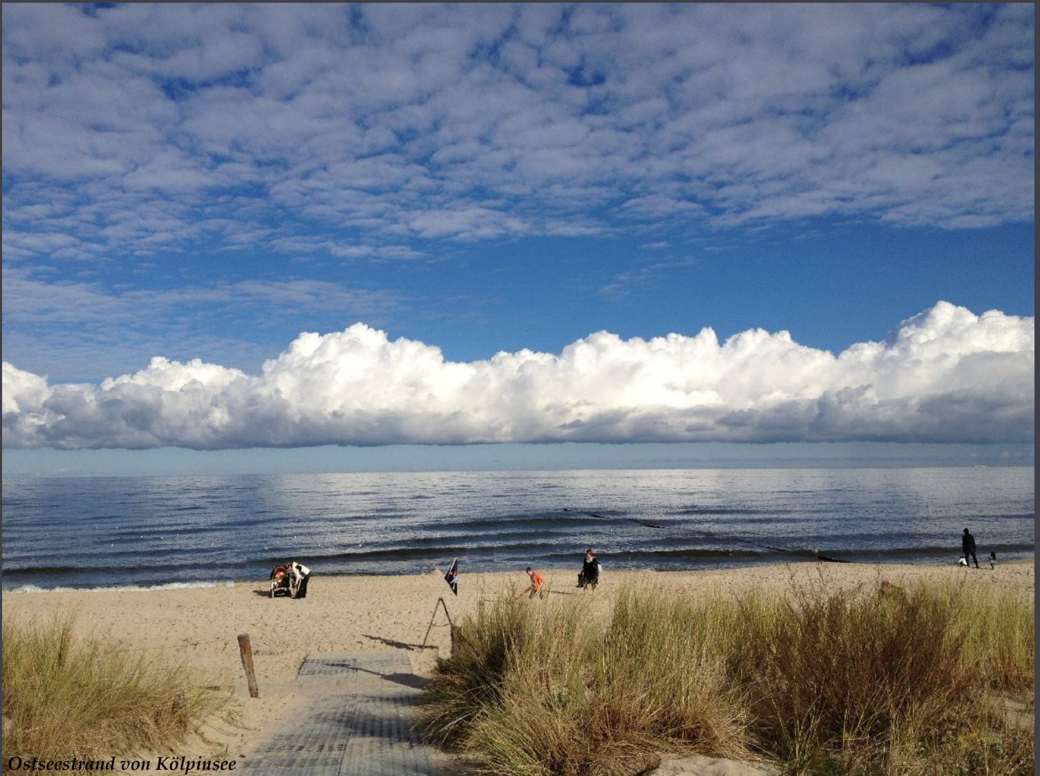
Ostseestrand von K lpinsee

Die sch nste Freude erlebt man immer da, wo man sie am wenigsten erwartet hat.