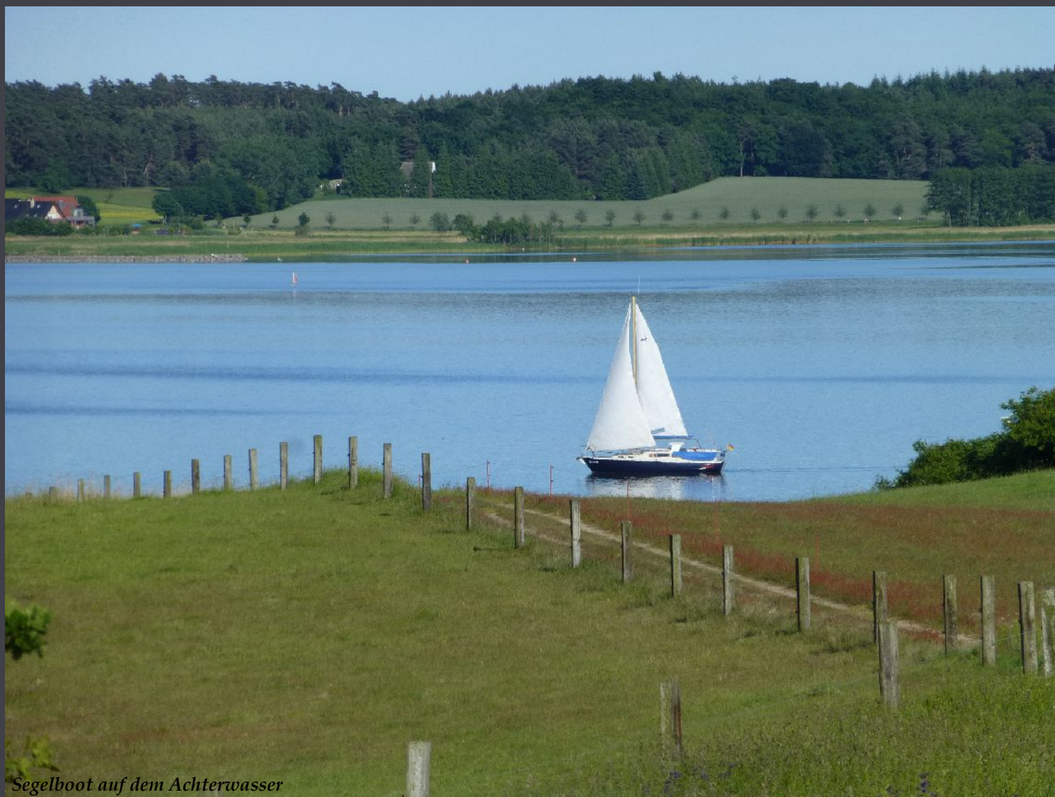
Segelboot auf dem Achterwasser

Reisen ist das Entdecken, dass alle Unrecht haben mit dem, was sie über andere Länder denken.