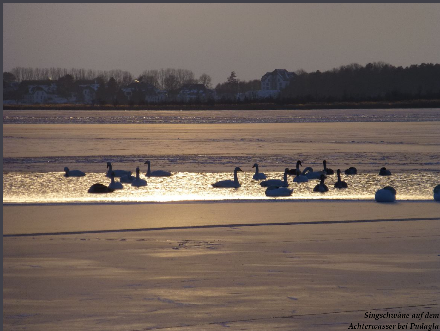
Singschwäne auf dem Achterwasser bei Pudagla

Schön ist alles, was man mit Liebe betrachtet.