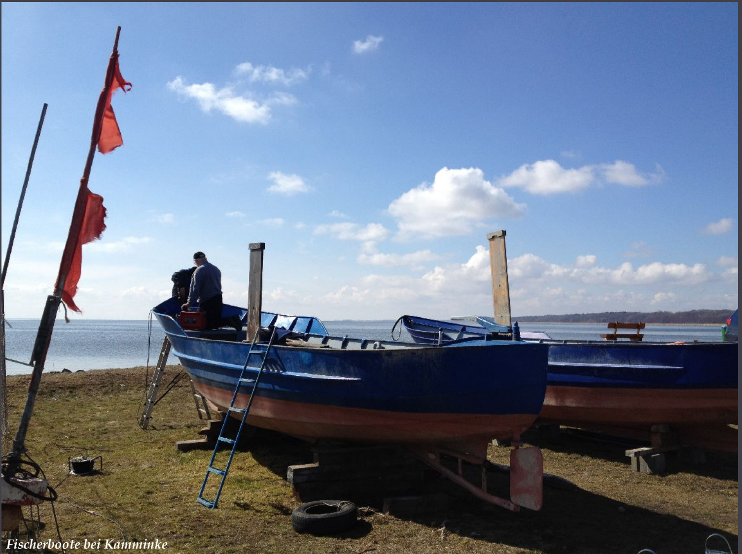
Fischerboote bei Kamminke

Es ist keine Schande, nichts zu wissen, wohl aber, nichts lernen zu wollen.