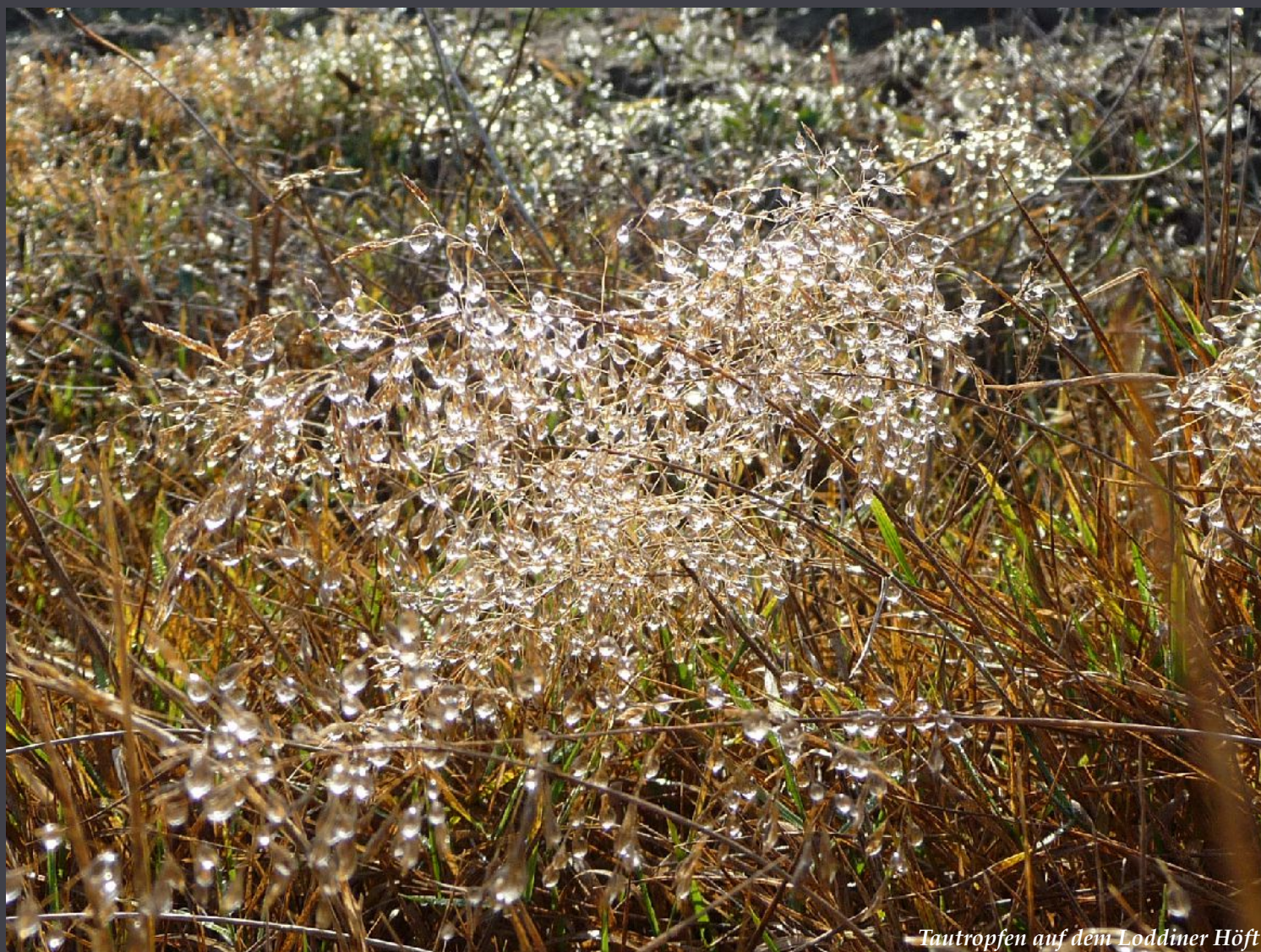
Tautropfen auf dem Loddiner Höft

Wir sollten das Leben verlassen wie ein Bankett: weder durstig noch betrunken.