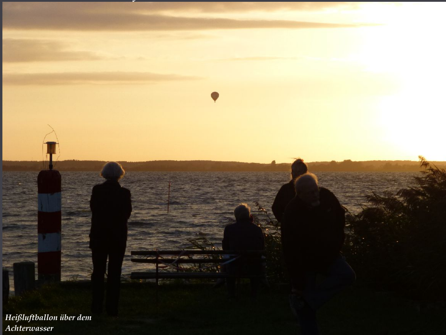
Heißluftballon über dem Achterwasser

Wieviel Freude schläft in uns – und wir wecken sie nicht!