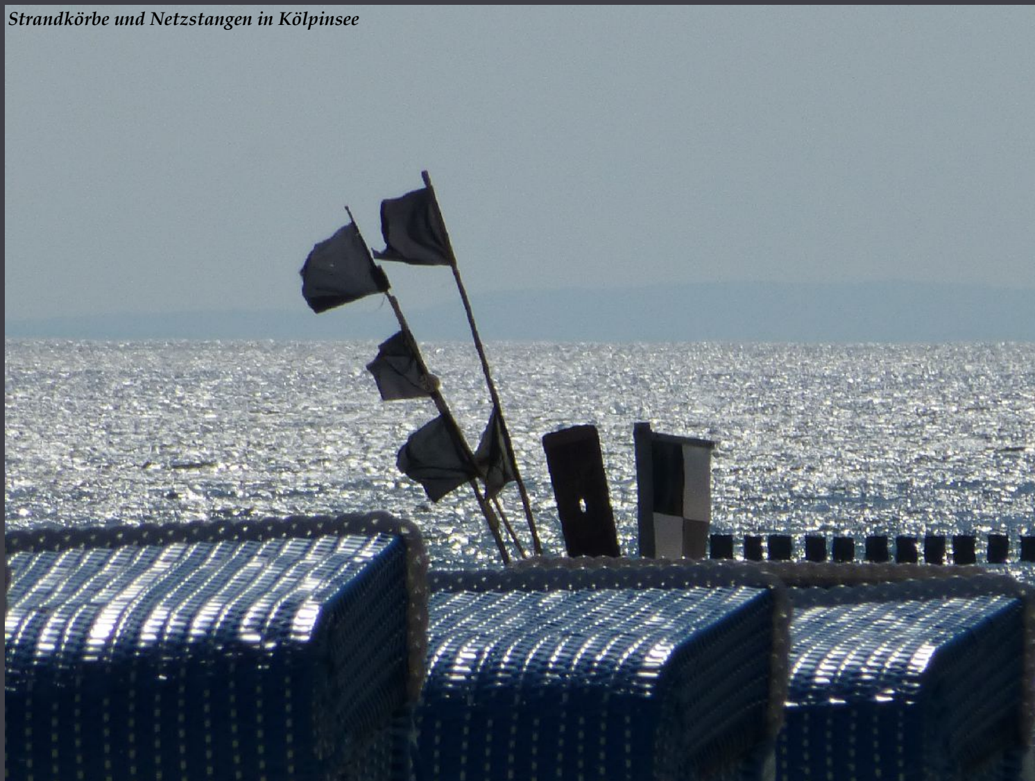
Strandkörbe und Netzstangen in Kölpinsee

Die meisten Menschen sind so glücklich, wie sie es sich selbst vorgenommen haben.