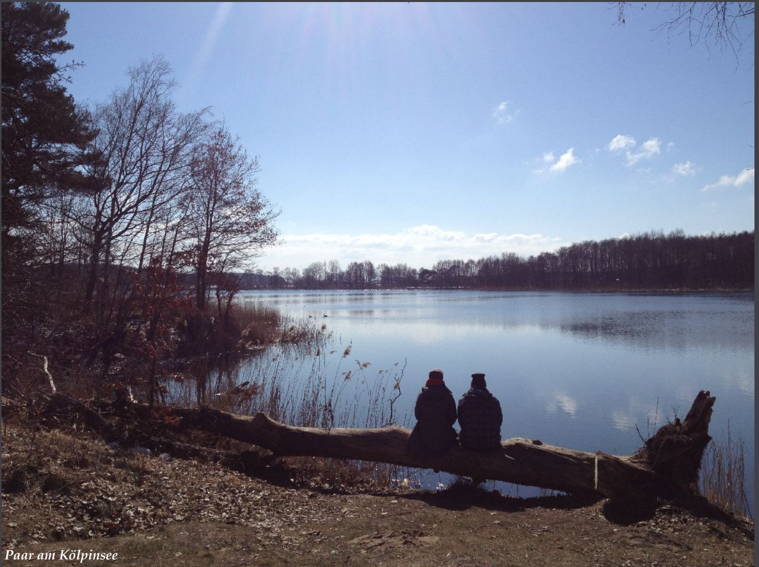
Paar am Kölpinsee

Gib jedem Tag die Chance, der schönste deines Lebens zu werden.