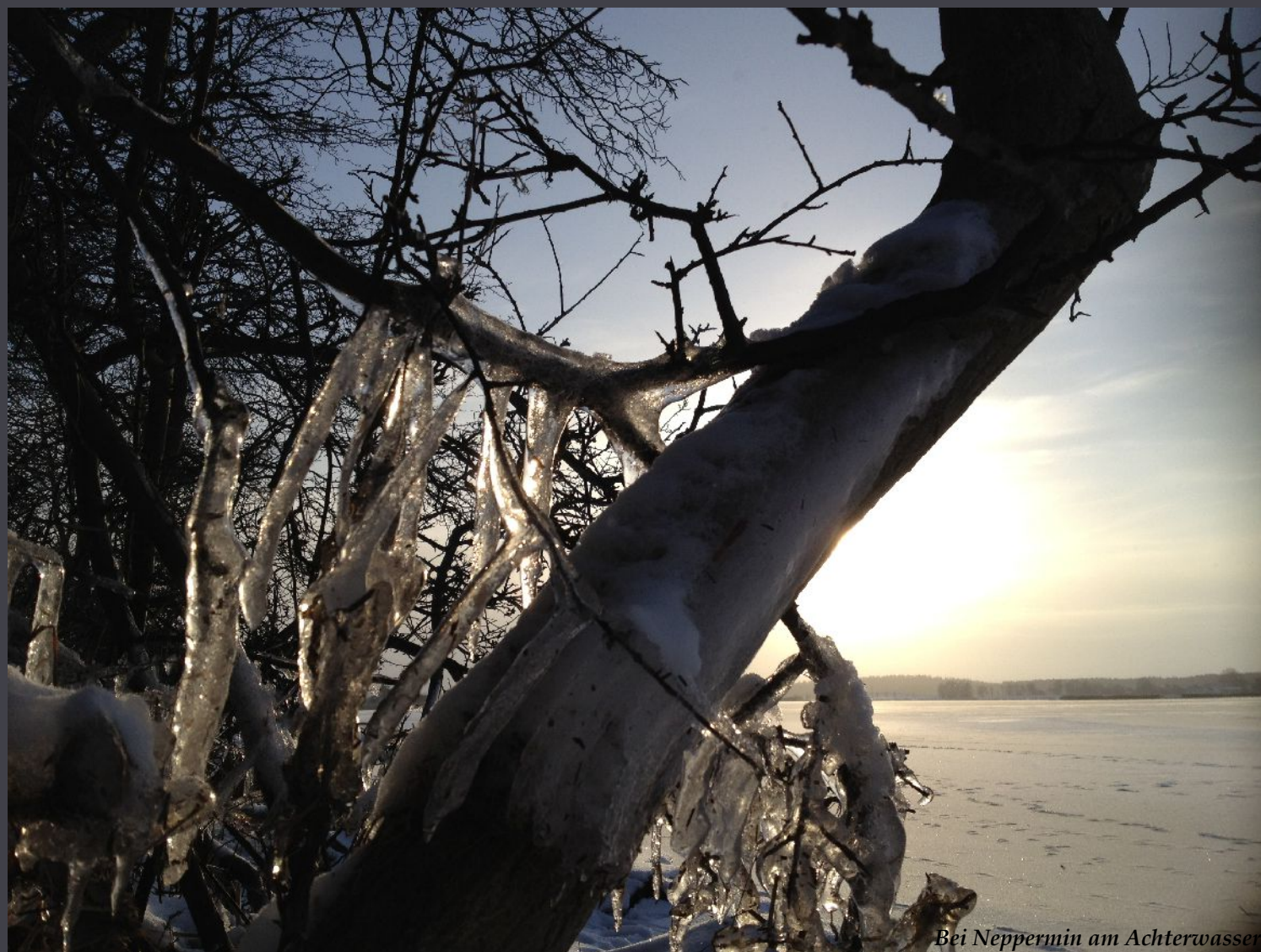
Bei Neppermin am Achterwasser

Die größten Ereignisse sind nicht die lautesten, sondern die stillsten Stunden.