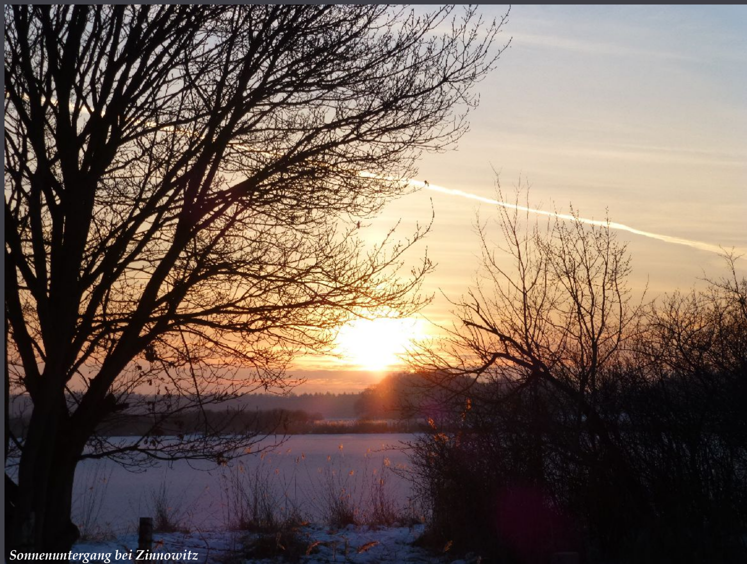
Sonnenuntergang bei Zinnowitz

In jedem Jahr sind die schönsten Tage – am kürzesten.